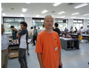
マイクロ波映 送受信実演