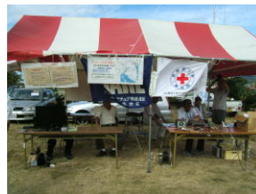
(左) は日赤アマチュア無線奉仕団との合同テント テント内で運用される HF と日赤車両